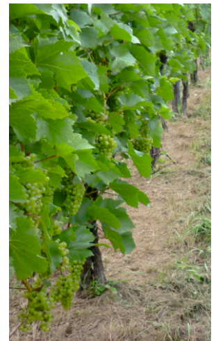
Arbeitsergebnis von Schwenkscheibe & Stockputzer