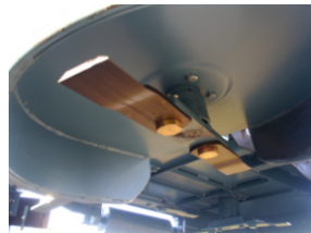
Messerkreisel in der Schwenkscheibe