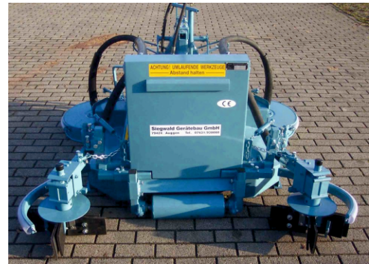
Rückseite mit Laufwalze und Stockputzer